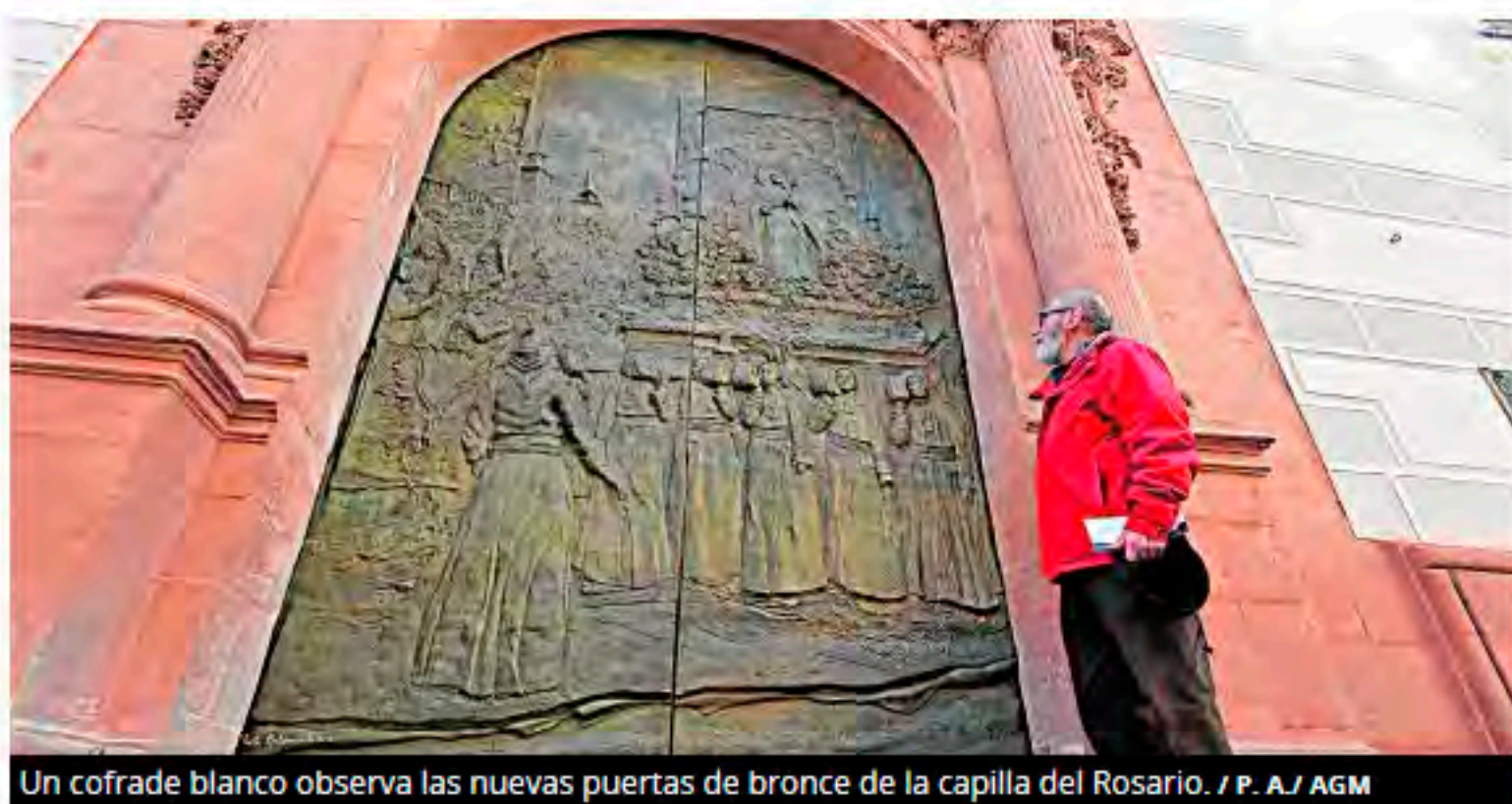
Un cofrade blanco observa las nuevas puertas de bronce de la capilla del Rosario.