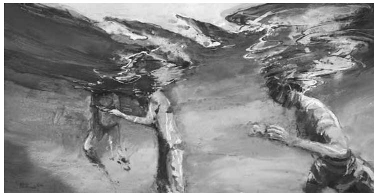
Encuentro bajo el agua. 64 x 122 cms.

2016 Espacio para Casa Decor “La ínsula de los sentidos”. Madrid.