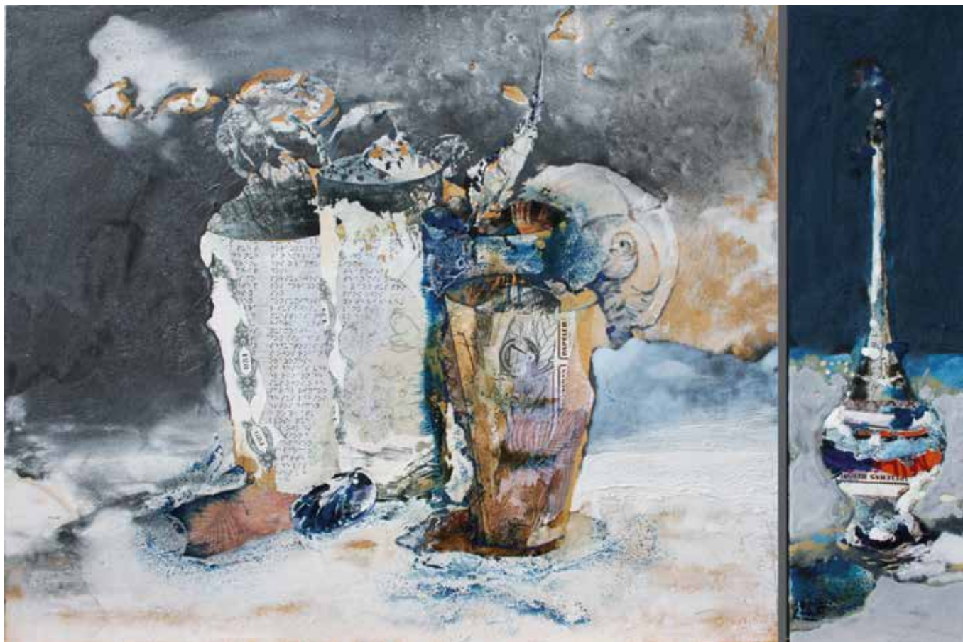
Dos culturas y un sueño. Técnica mixta sobre madera. 46 x 68 cms. (díptico)