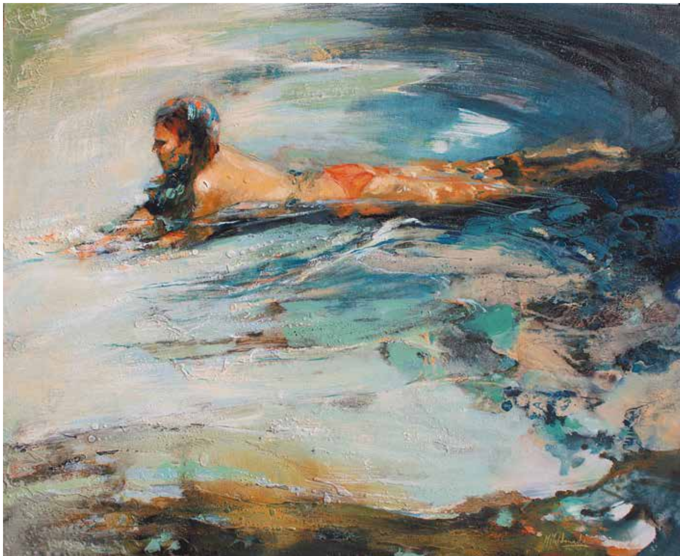
En la línea de la superficie. Técnica mixta sobre tela. 81 x 100 cms.