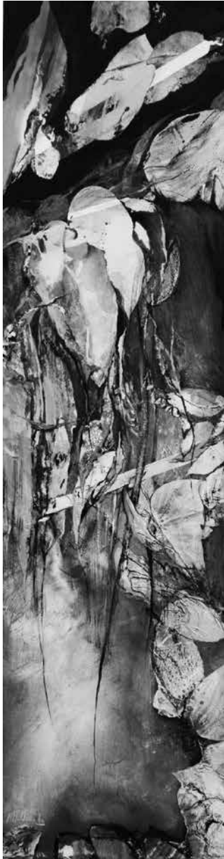
Catalpas. 150 x 40 cms.

Para esta exposición he creado y disfrutado en el proceso de una obra pasional y a su vez muy medida. Desbordante y contenida...con fuerza pero frágil y sutil. Con planteamientos fronterizos y quiebros inesperados.