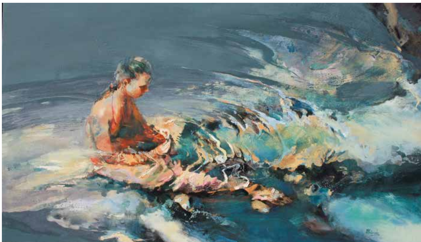
Lo sutil y lo inmenso. Técnica mixta sobre tela. 114 x 195 cms.