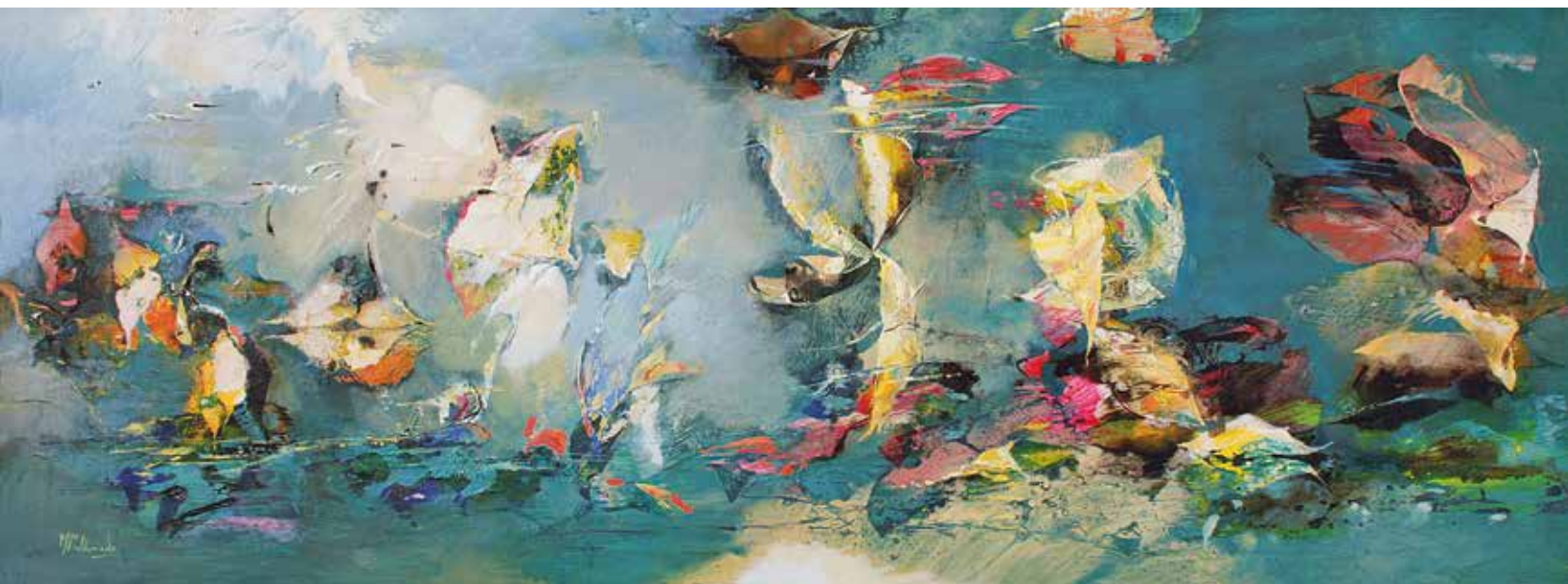
Entre el mar y la tierra. Técnica mixta sobre madera. 58 x 156 cms.