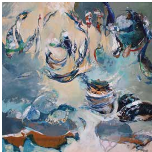
Ingravidéz. 100 x 100 cms.