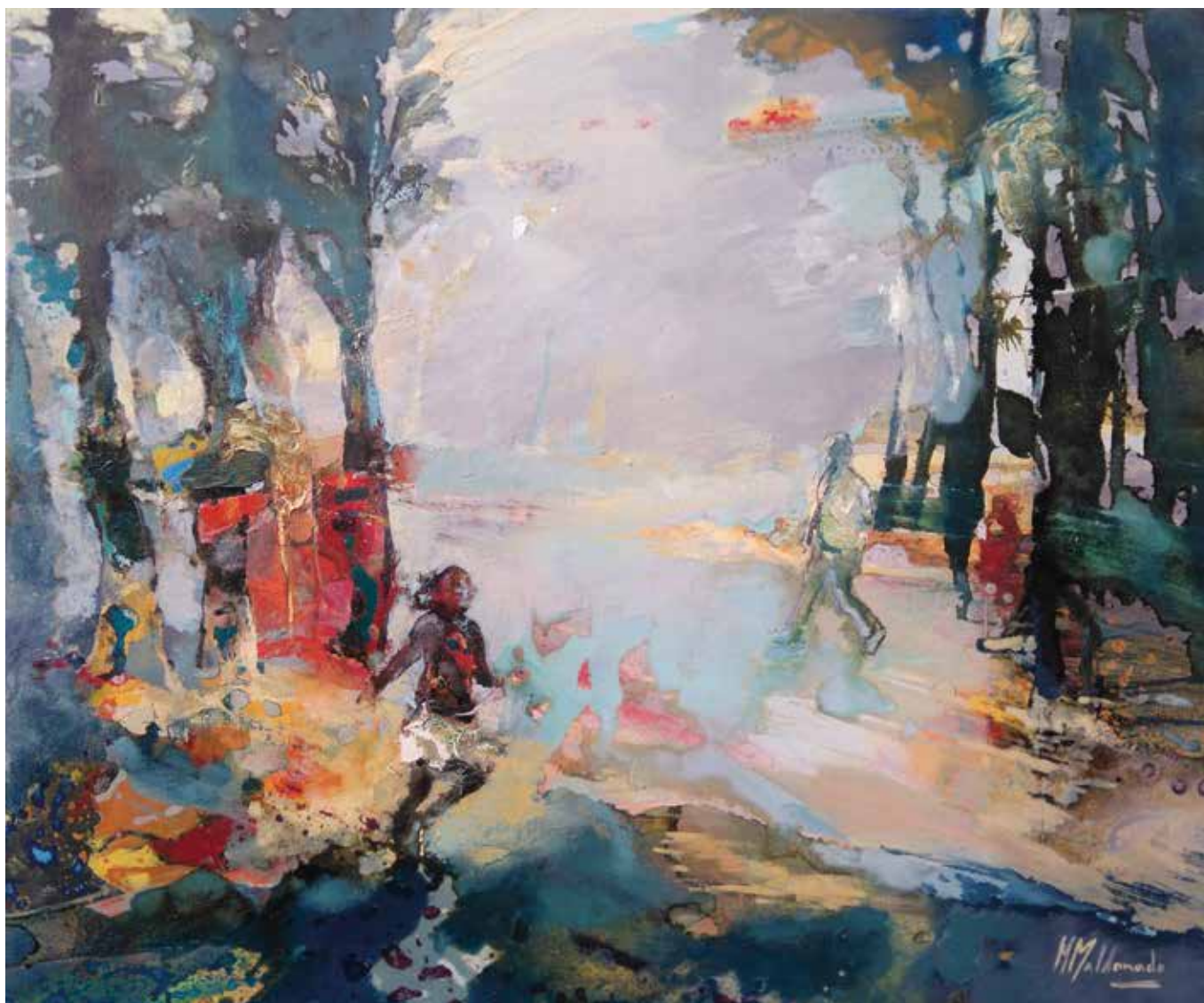
Jugando a no ser visto. Técnica mixta sobre tela. 50 x 60 cms.