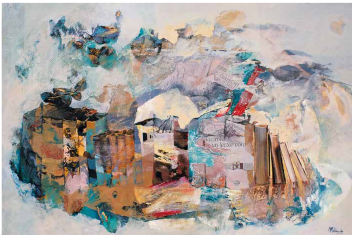
El nacimiento de un lector voraz. Técnica mixta sobre tela. 97 x 146 cms.