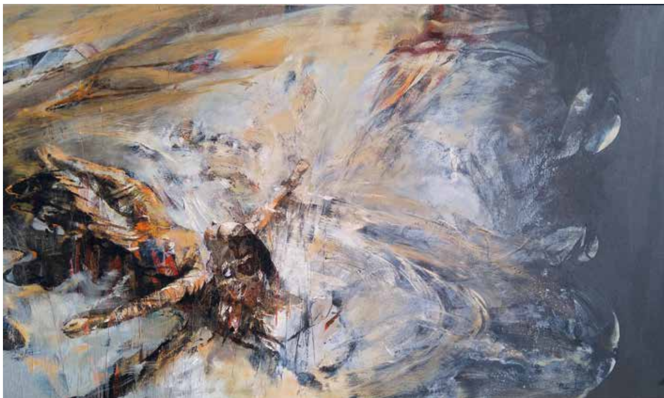
Luna y el mar.

Técnica mixta sobre madera. 114 x 195 cms.