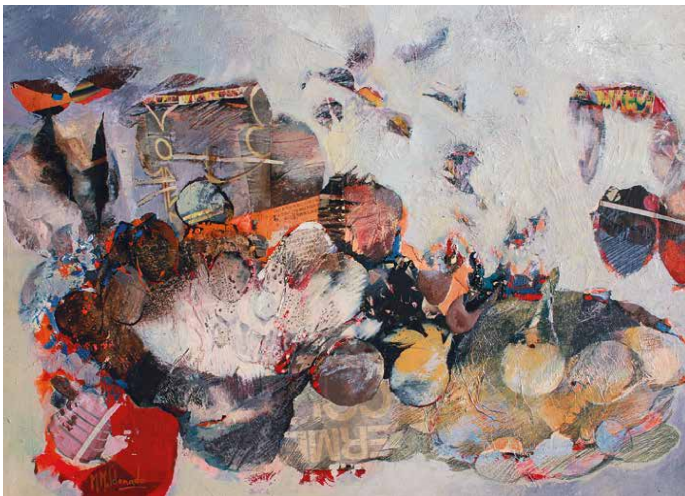
El movimiento sutil de las formas. Técnica mixta sobre madera. 44 x 61 cms.